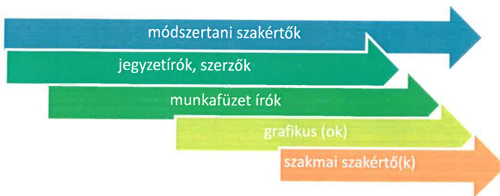
3. sz. ábra – a taneszközfejlesztők bekapcsolódása a fejlesztési folyamatba

Miután a taneszközfejlesztés szakmai-módszertani része befejeződött, akkor léphetnek be a fejlesztések záró szakaszába a nyelvi lektorok.